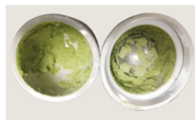
棉花叶片样本研磨效果图