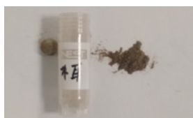
木耳样本研磨效果图