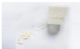
骨头样本研磨效果图