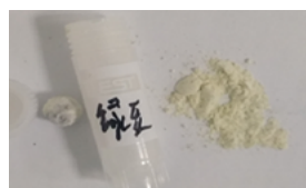
绿豆样本研磨效果图